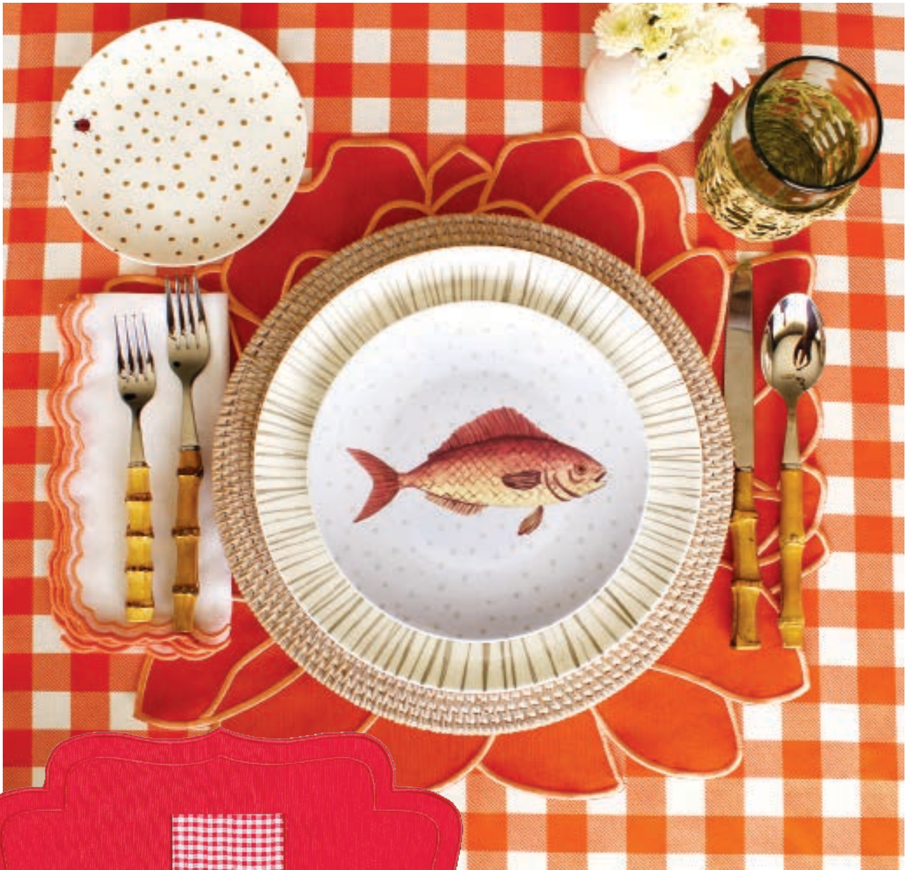
FOTO: SET DE ZARINA RIVERA Y MARGARITA PÉREZ-CUÉLLAR Y PRODUCTO DE RODRIGO DÍAZ.