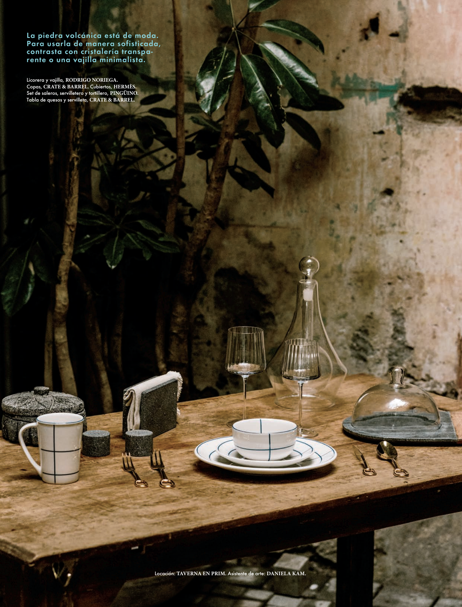
Tabla de quesos y servilleta, CRATE & BARREL.

Set de saleros, servilletero y tortillero, PINGÜINO.