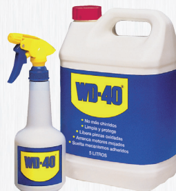
Garrafa 5 litros

O formato Dupla Acção permite uma aplicação ampla ou precisa do produto, garantindo que a cânula nunca se perderá