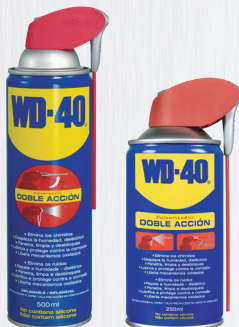
Spray Dupla Acção 250ml e 500ml

O formato flexível permite que você alcance onde outros não chegam sem a necessidade de desmontar a área a ser reparada.