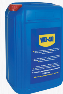
Bidón 25 litros

Garrafa para uso industrial que é acompanhada de um pulverizador para uma aplicação mais simples