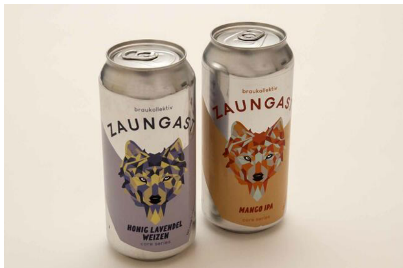
Auch die Hopfensorten Simcoe und Amarillo werden verwendet.

Wohlkoenig kehrte nach Österreich zurück und suchte vergeblich nach einem ähnlichen Geschmackserlebnis, also begann er sich schlau zu machen, wie man denn dieses Getränk selbst herstellen könnte. Zahlreiche gescheiterte Versuche im Keller seiner Oma brachten kein brauchbares Ergebnis, also besuchte er Braukurse und Bierseminare und stöberte wochenlang im Internet nach Tipps und Tricks aus der Braukunst.