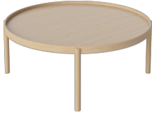
Tab Coffee Table Ø90, H34