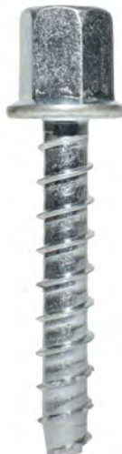
THD50234RH (vástago de 3/8" de diám.)