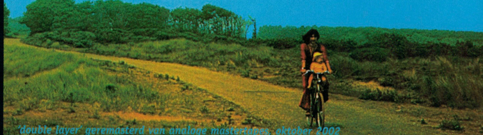
double layer gemastard van analoge mastertapes, oktober 2002