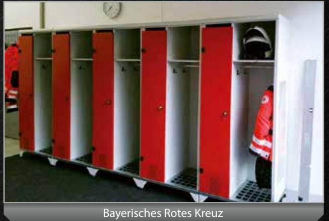
Bayerisches Rotes Kreuz