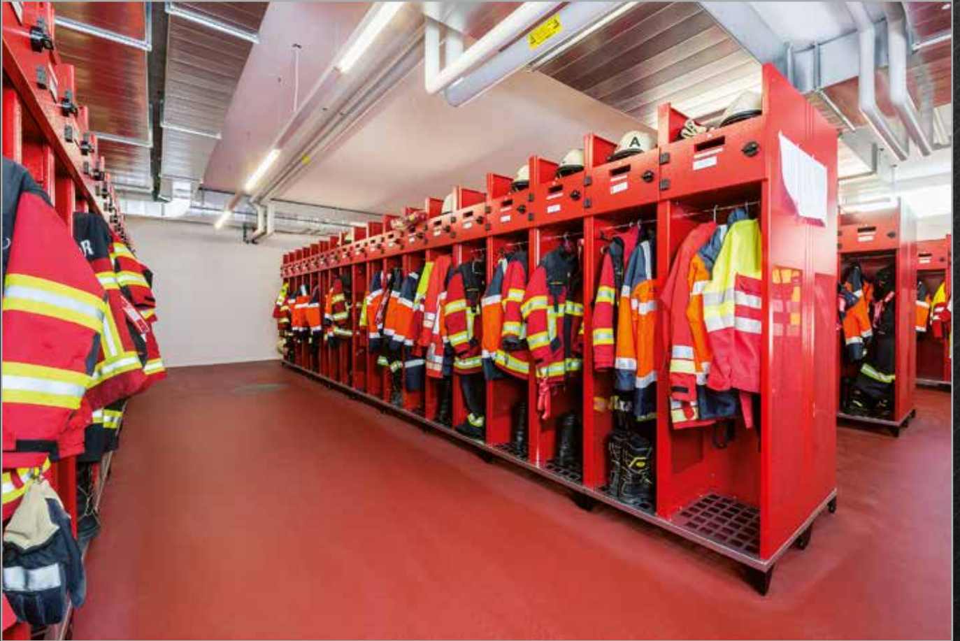
Feuerwehr Buochs Ennetbürgen