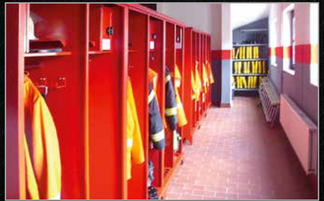
Freiwillige Feuerwehr Munchehof