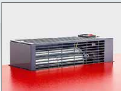
▲ Trockner (Leistungsaufnahme 500 W/Stunde)

Chromkleiderstange mit Haken, Helmhalter innen, Gürtelhaken, verschließbare Boxen, Trockner (Leistungsaufnahme 500 W/ Stunde)