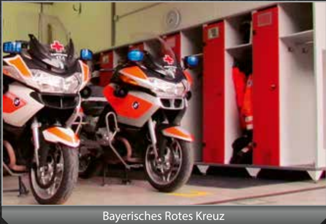
Bayerisches Rotes Kreuz