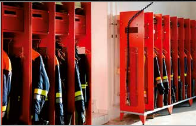
Freiwillige Feuerwehr Erpfting