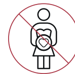
Femme enceinte & allaitante

IMPORTANT : TENIR HORS DE LA PORTÉE DES ENFANTS ET DES ANIMAUX. TENIR À L'ÉCART DE LA CHALEUR, DES FLAMMES ET DE LA LUMIÈRE. INFLAMMABLE.