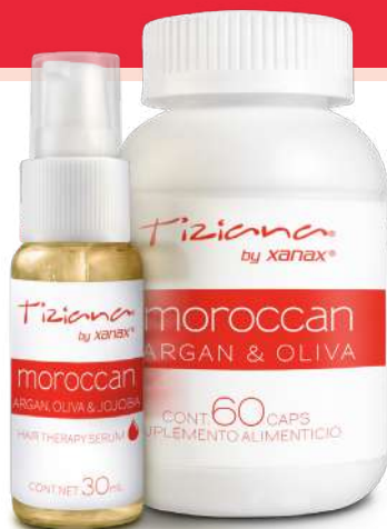
Bote con 30 mL de suero y bote con 60 cápsulas.

El suero Hidratante Moroccan ARGAN, OLIVA & JOJOBA de Tiziana, es un buen tratamiento de nutrición que regenera por completo todo cabello maltratado. Lo fortalece, hidrata, restaura y suaviza, proporcionándole brillo, vigor y un aspecto saludable. Está formulado con aceite de Argán, el mejor aliado para devolverle vida a tu cabello al nutrir, renovar y regenerar regresándole su brillo natural gracias a su alto contenido en ácidos omega 3, 6, y 9, y vitamina E. El suero Hidratante Moroccan ARGAN, OLIVA & JOJOBA está complementado con Aceite de Oliva, que agrega brillo y humedad a tu cabello. El Aceite de Jojoba es una cera vegetal de múltiples propiedades para tu cabello, uñas y piel, proporcionándole mayor brillo, suavidad e hidratación al cabello, ayudando en su regeneración y actuando contra la grasa y sequedad cutánea.