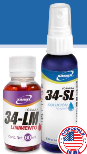
Frasco con 60 mL de linimento. Atomizador con 60 mL de solución (no graso).

Xanax cuenta con fórmulas especialmente preparadas para ayudar en el alivio de dolores crónicos, musculares, artríticos y reumáticos. Nuestras fórmulas 34-LM Linimento y 34-SL Solución (no graso) se recomiendan para personas que sufren dolores artríticos, reumáticos y musculares causados por ejercicio diario, lesiones deportivas, estrés, cansancio, trabajos físicos pesados, cambios bruscos de temperatura, dolores lumbares, torceduras y picaduras de insectos. Se pueden emplear también para masajes.