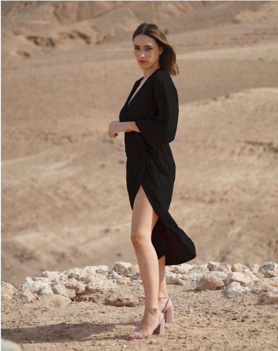
Robe en soie BELEM