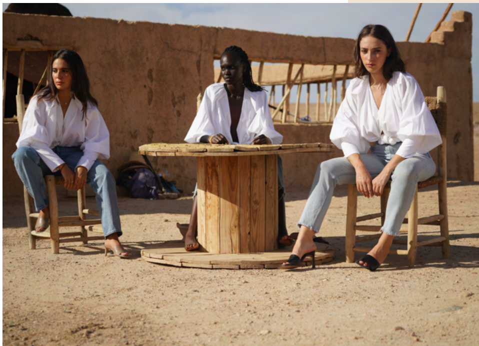
Chemise oversized en coton LIMA