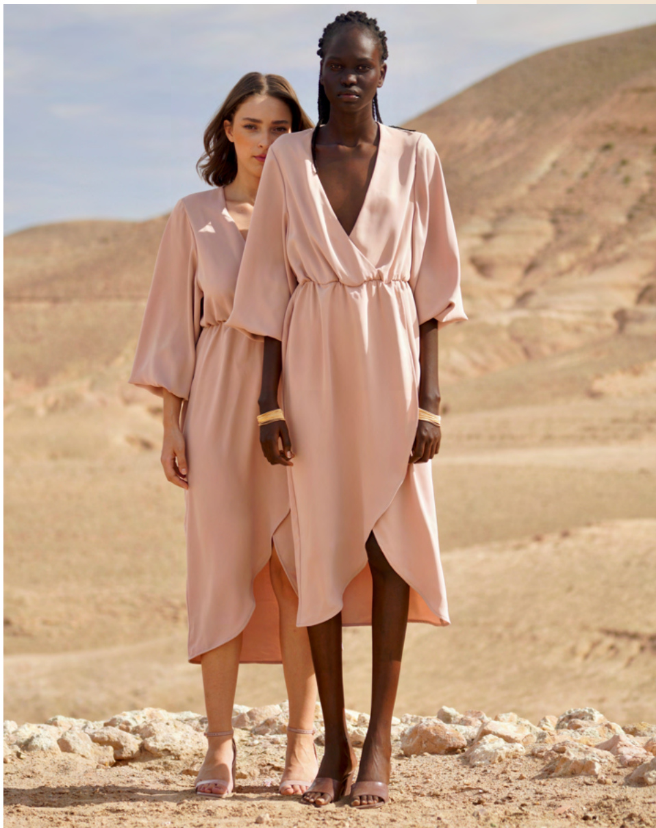
Robe en soie SYBEL