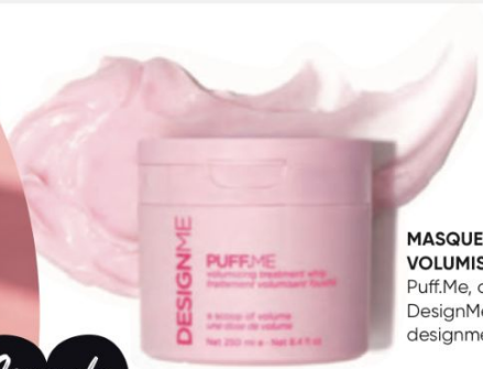
MASQUE FOUETTÉ VOLUMISANT Puff.Me, de DesignMe, 30 $, à designmehair.ca.