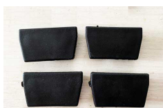
Ändkåpor för monterings-skenorna x4