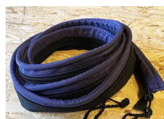
Dragkedja x1 (sitter fast i transportskyddet)