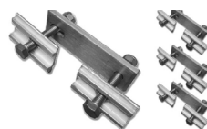
8mm rostfria bultar i glidande monteringsplattor + plattjärn med förborrade hål x4