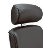
Kopfstütze verstellbar Appuie-tête, réglable