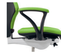
Fixe Armlehne gepolstert Accoudoirs fixes rembourrés