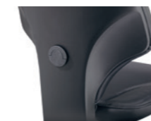
Tiefenverstellbare Lordosenstütze Soutien lombaire réglable en profondeur

* 1D = höhenverstellbar réglable en hauteur 4D = höhen-, breiten- und tiefenverstellbar réglable en hauteur, en largeur et en profondeur