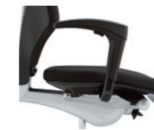
1D-Armlehne* ungepolstert Accoudoirs 1D* non rembourrés