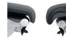
Standardpolster (links) Komfortpolster (rechts) Rembourrage standard (à gauche), rembourrage confort (à droite)