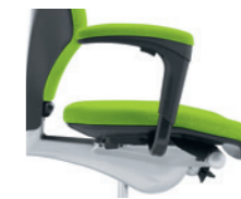
1D-Armlehne* gepolstert Accoudoirs 1D* rembourrés