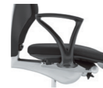
Fixe Armlehne ungepolstert Accoudoirs fixes, non rembourrés