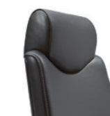
Kopfstütze fix Appuie-tête, fixe

giroflex 64 – Drehstuhl: Der Chefsessel ist mit Komfortpolsterung, breitem Sitz und hoher Rückenlehne (auf Wunsch bezogen) ausgestattet. Optional mit tiefenverstellbarer Lordosenstütze erhältlich. Diverse Bezugsmaterialien in verschiedenen Farben. Mit fixen oder 3D-Armlehnen, Kopfstütze in zwei verschiedenen Ausführungen und Kleiderbügel lieferbar. 5-Sternfuss Aluminium poliert oder pulverbeschichtet in diversen Farben. Rollen 50 mm oder optional 65 mm.