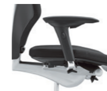
4D-Armlehne* ungepolstert Accoudoirs 4D* non rembourrés