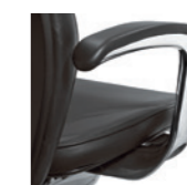
Armlehne gepolstert Accoudoirs, rembourrés