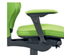
4D-Armlehne* gepolstert Accoudoirs 4D* rembourrés

* 1D = höhenverstellbar réglable en hauteur 4D = höhen-, breiten- und tiefenverstellbar réglable en hauteur, en largeur et en profondeur