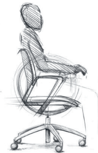
Skizzen Illustrations: Paolo Fancelli

La Force et le Corps pour les Humans en mouvement. Un siège pivotant est synonyme de mouvement. Sa spécificité réside dans le pivotement et l'oscillation. La forme idéale pour le mouvement, c'est la boule. C'est le seul corps rotatif sans restriction qui conserve toujours une élégance absolue. Même lorsqu'une boule est usinée, réduite par découpage et évidage, la géométrie d'une boule demeure intacte et visible. C'est le cas aussi avec le giroflex 313. La géométrie stricte place l'être humain au centre. Le giroflex 313 est présent, pas dominant. Il est dédié à sa fonction.