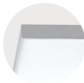
E Silver Anodised