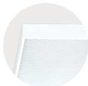
W Snow White