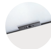
Multisensor/HCL /Swarm Control