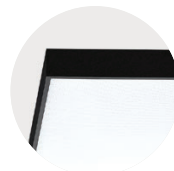
B Jet Black