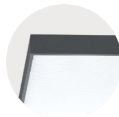
U Urban Graphite