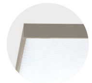
H Anodic Champagne