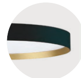
B Jet Black G Satin Gold