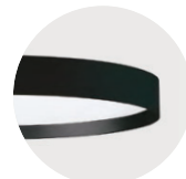
B Jet Black B Jet Black