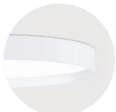
W Snow White W Snow White