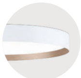
W Snow White K Satin Copper