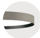
H Anodic Champagne B Jet Black