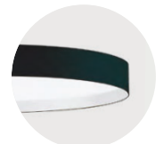
B Jet Black W Snow White