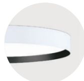
W Snow White B Jet Black