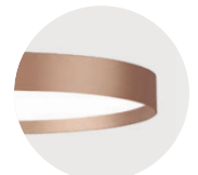
K Satin Copper K Satin Copper