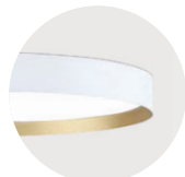
W Snow White G Satin Gold