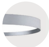
S Radiant Silver S Radiant Silver