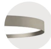
H Anodic Champagne H Anodic Champagne