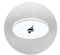
Multisensor/HCL /Swarm Control