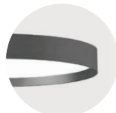
U Urban Graphite U Urban Graphite