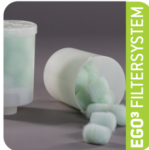
EGO 3 FILTERSYSTEM