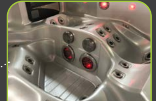
2 LED FOOTBLASTER™