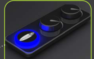
4 DIRECT FLOW™