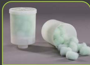
EGO 3 FILTERSYSTEM