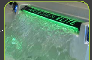
1 LED WASSERFALL