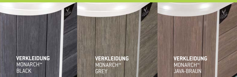
VERKLEIDUNG MONARCH™ BLACK

* Bedienung, Steuerung und Verteilung der Technik