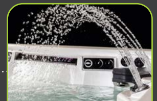
4 LED FONTAINEN