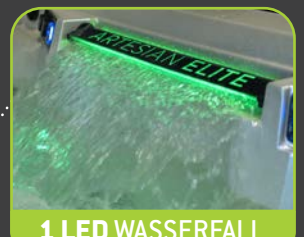
1 LED WASSERFALL