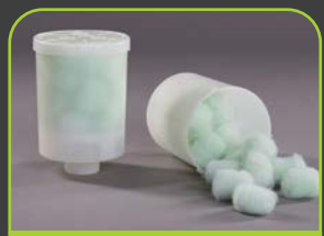
EGO 3 FILTERSYSTEM