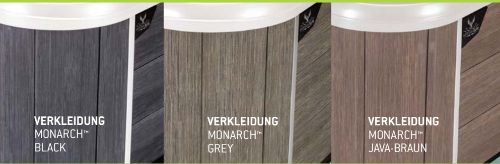
VERKLEIDUNG MONARCH™ BLACK

* Bedienung, Steuerung und Verteilung der Technik