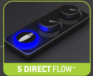
5 DIRECT FLOW™