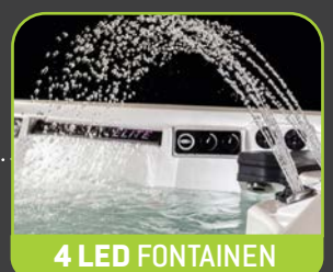
4 LED FONTAINEN