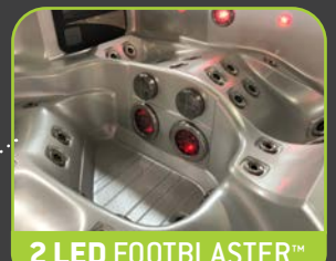
2 LED FOOTBLASTER™