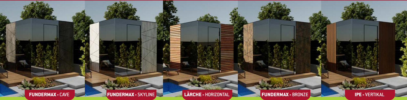
FUNDERMAX - CAVE