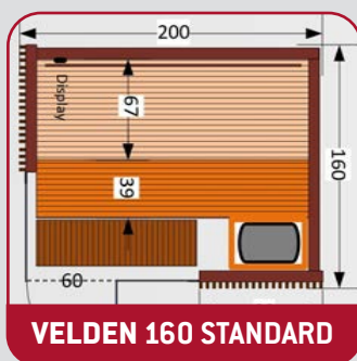
VELDEN 160 STANDARD

Maß- oder bau- und ausstattungsbedingte Änderungen bedürfen einer separaten Planung und können zu längeren Produktions- und Lieferzeiten führen.