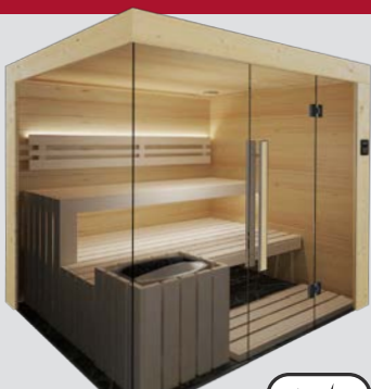
Nord. Fichte & Espe Hell