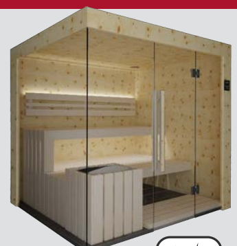
Zirbenholz & Espe Hell