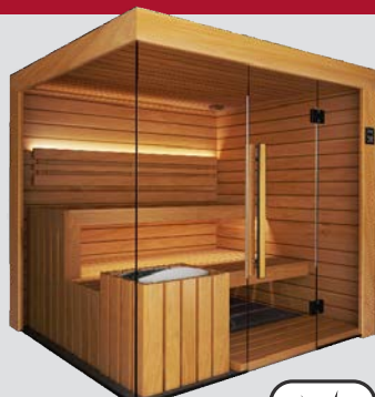
ThermoEspe & ThermoEspe