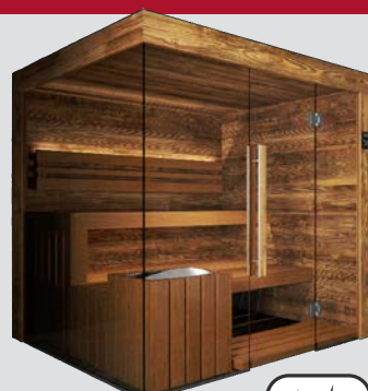
TyrolHolz & ThermoEspe