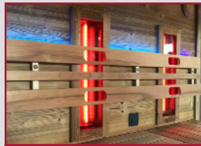
INFRA-ROT LICHT OPTION