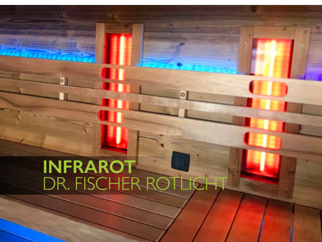
INFRAROT DR. FISCHER ROTLICHT

LIEFERUNG & MONTAGE: Die Sauna wird im Werk vorgefertigt und nach terminlicher Vereinbarung direkt zur Baustelle geliefert. Die Einbringung kann mittels Kran, Stapler oder Helikopter erfolgen. Grundsätzlich obliegt die Organisation aller Einbringungsmaßnahmen dem Kunden, sollte nichts anderes vereinbart worden sein. Die Endfertigung und Fertigstellung inkl. Stromanschluss für Testzwecke, Inbetriebnahme, Funktionstest, Einschulung und Übergabe aller Anleitungen wird von unserem Montageteam vorgenommen.