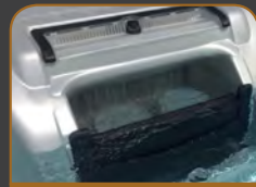
EGO 3 FILTERSYSTEM