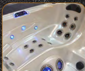
2 ERGO LIEGEN