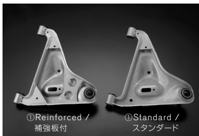
① Reinforced / 補強板付