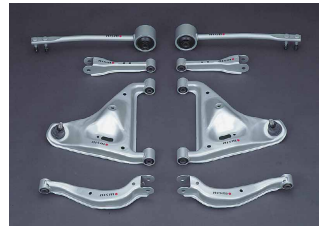
Suspension Link / サスペンションリンク式