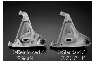
③Reinforced / 補強板付 ③Standard / スタンダード ③Rear A Arm / リヤAアーム