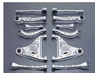
Suspension Link / サスペンションリンク一式 (写真はS14用)