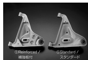
⑤ Reinforced / 補強板付 ⑥ Standard / スタンダード ⑤ Rear A Arm / リヤAアーム