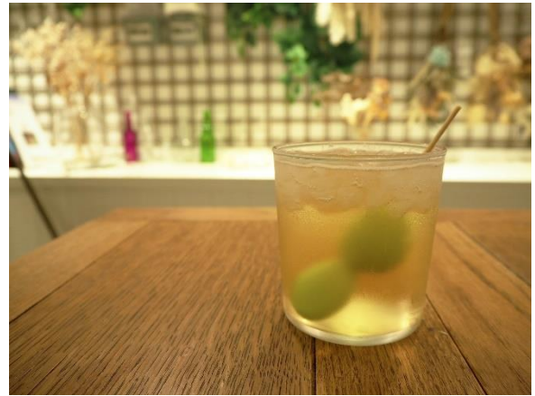
「カクテル“ROCK STEADY ”」

生のショウガと数種のスパイスに、ピーチとシャインマスカットの甘さが交わり、さらにトニックで苦みを追加