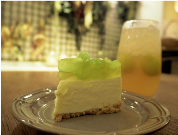
「山梨県産シャインマスカットのレアチーズケーキ」（手前）