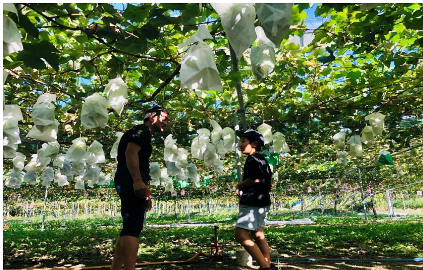
日本・ニュージーランドでの通年生産イメージ(日本式のぶどう棚で露地栽培)

※三井不動産グループ内で新規事業案を募集し、採用された場合提案者自らが責任者として事業を実施する制度