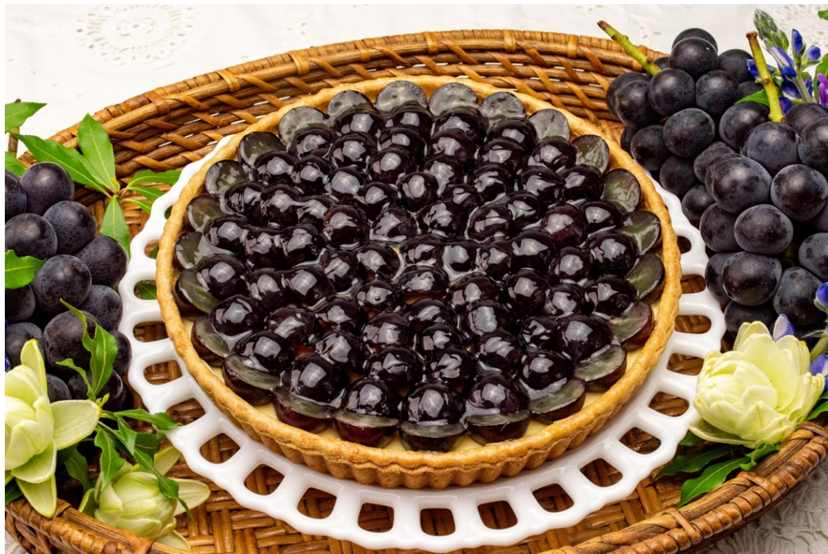
『極旬ぶどう』“裏旬 巨峰” と“ル ガール”クリームチーズのタルト

ニュージーランドの豊かな自然環境の中で育てられた裏旬巨峰は皮ごと食べられることができ、その魅力を存分に楽しんでいただける、シンプルな組み合わせのタルトになっております。