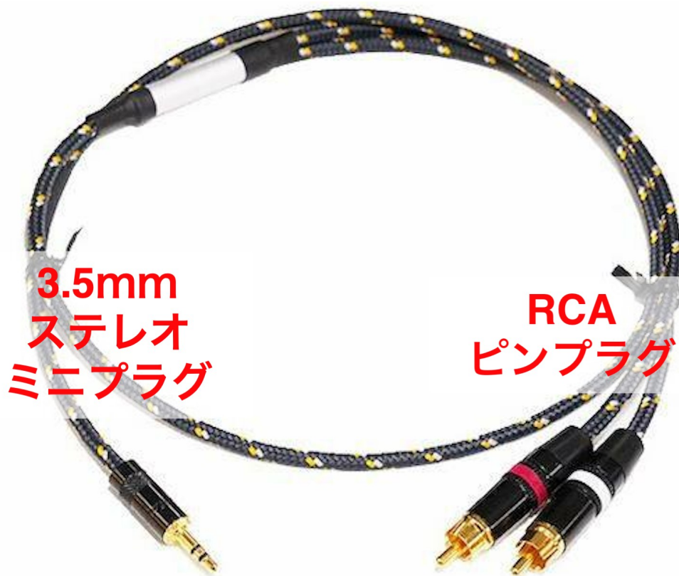
3.5mm ステレオミニプラグのケーブル