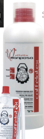
CAFFÉLATEX 1000 ML cod. EMCHCL1000