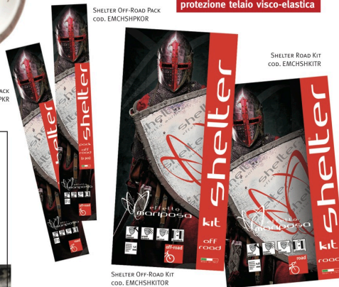
SHELTER OFF-ROAD KIT cod. EMCHSHKITOR