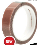
CAROGNA S cod. EMCHCRS