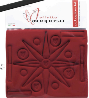
OCTOPLUS KIT cod. EMCHOPKIT