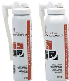
ESPRESSO 75 ML cod. EMCHESP75