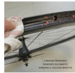
CAROGNA REMOVER: REMOVES OLD MASTIC RIMUOVE IL VECCHIO MASTICE