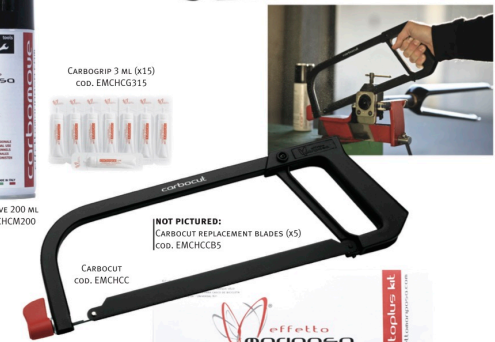
CARBOCUT cod. EMCHCC

NOT PICTURED: CARBOCUT REPLACEMENT BLADES (x5) cod. EMCHCCBS