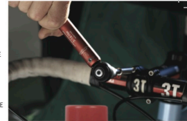
GIUSTAFORZA II 2-16 cod. EMCHGF2216

GIUSTAFORZA II 2-16 PRO DELUXE cod. EMCHGF2PB216