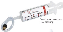
CAFFÉLATEX LATEX INJECTOR cod. EMCHCI

NOT PICTURED: CAFFÉLATEX TUBELESS KIT Off-Road L cod. EMCHCLKITORL