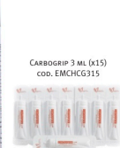
CARBGRIP 3 ML (x15) cod. EMCHCG315

NOT PICTURED: CARBOCUT REPLACEMENT BLADES (x5) cod. EMCHCCBS