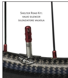
SHELTER ROAD KIT: VALVE SILENCER SILENZIATORE VALVOLA