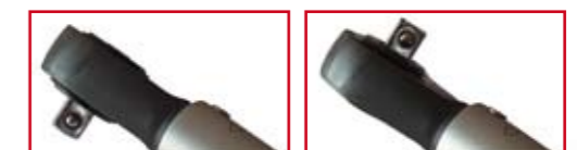
TESTA CON CRICCHETTO REVERSIBILE REVERSIBLE RATCHETING HEAD

La chiave dinamometrica Giustaforza II ha testa semplificata per minimo ingombro: precisione e qualità professionali per il meccanico amatoriale. Le chiavi di livello "Pro" sono pensate per un efficiente uso professionale, grazie alla testa a cricchetto (1/4" per la 2-16 Nm, 3/8" per la 10-60 Nm). Le più usate dai migliori meccanici ciclisti nel mondo.