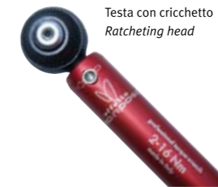
Testa con cricchetto Ratcheting head

Senza inserti - no bits: GIUSTAFORZA II 2-16 PRO COD. EMGF2P216