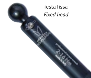
Testa fissa Fixed head

Senza inserti - no bits: GIUSTAFORZA II 2-16 COD. EMGF2216