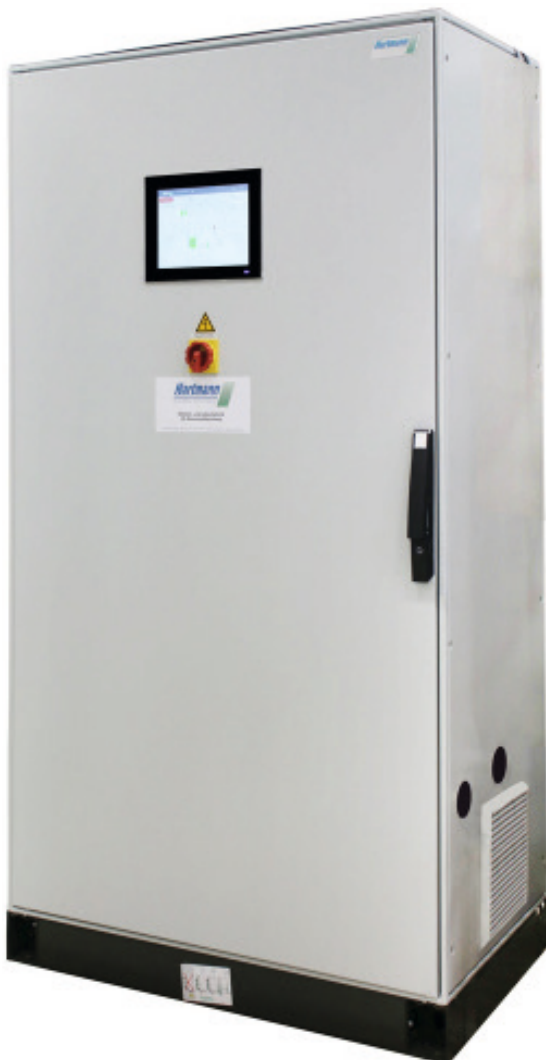
Image: HA-RO complete EDI / Variante bis 500 l/h

VE- ODER REINWASSERAUFBEREITUNG FÜR MEDIZIN, PHARMA, LABOR UND INDUSTRIE