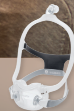
DreamWear Full Face