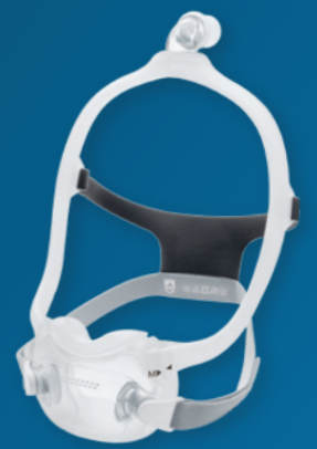
DreamWear Full Face