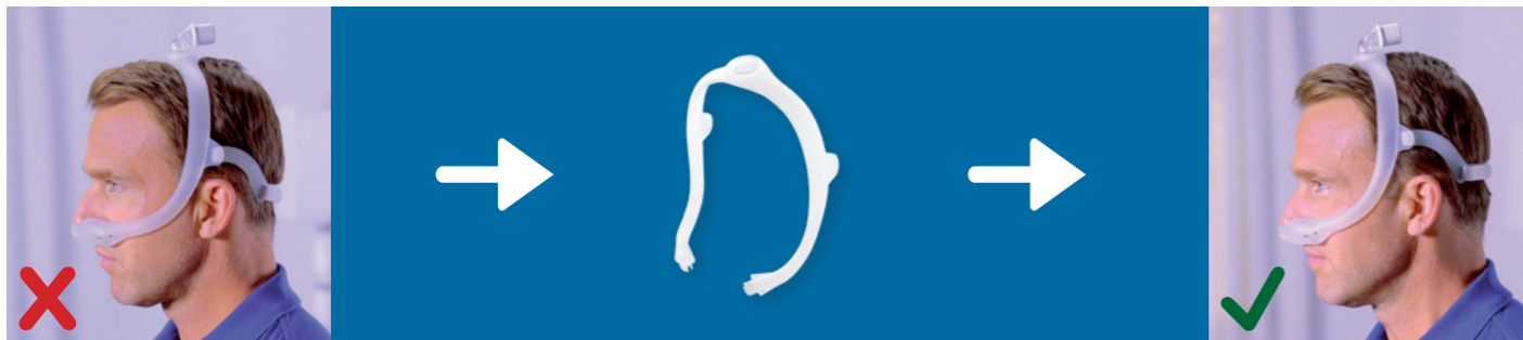
Rahmen zu groß