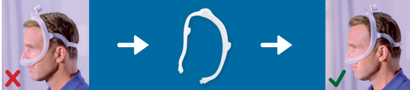
Rahmen zu klein