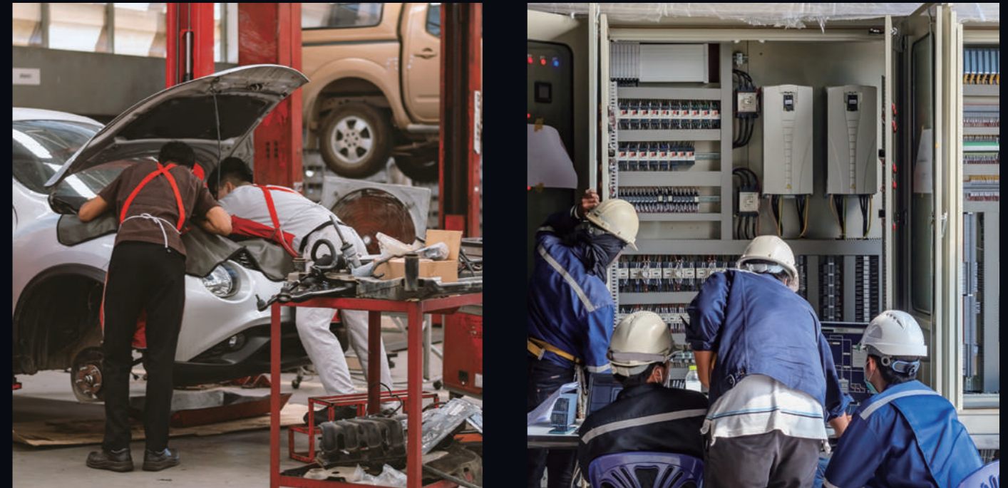
自動車整備や電気工事など「作業時間=コスト」に直結するプロなら、ライト選びも慎重に行いたい

「ライトは、とにかく明るい方がいい」。本当にそれだけでしょうか？ 点検や修理作業、床に落ちた部品探しひとつにしても、 中心が白とびし、外周にムラがある光では、極端に作業効率が悪くなります。