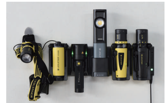
作業場に常設し、5台まで同時充電できる「5ステーションチャージングパネル」 メーカー希望小売価格：¥8,000+税 型番：0412

IP54/52 をクリアし、多少の粉じんや水飛沫を気にせず作業可能。また、全モデルが5段階の充電インジケータを搭載し、充電残量も一目でわかります。iW7R は専用充電スタンドを付属し、別売りの5ステーションパネルにも対応。iW シリーズには、日々の仕事を便利にする機能が詰め込まれています。