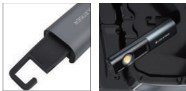
ビルトインフック 底面マグネット