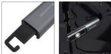
ビルトインフック 底面マグネット