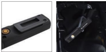
裏面クリップ 底面マグネット