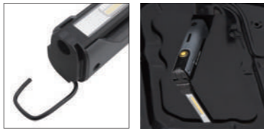
ワイヤーフック 底面マグネット