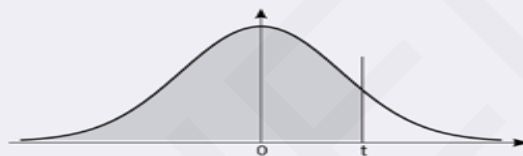
Table donnant P(Z < t) pour une variable aléatoire suivant N(0,1)