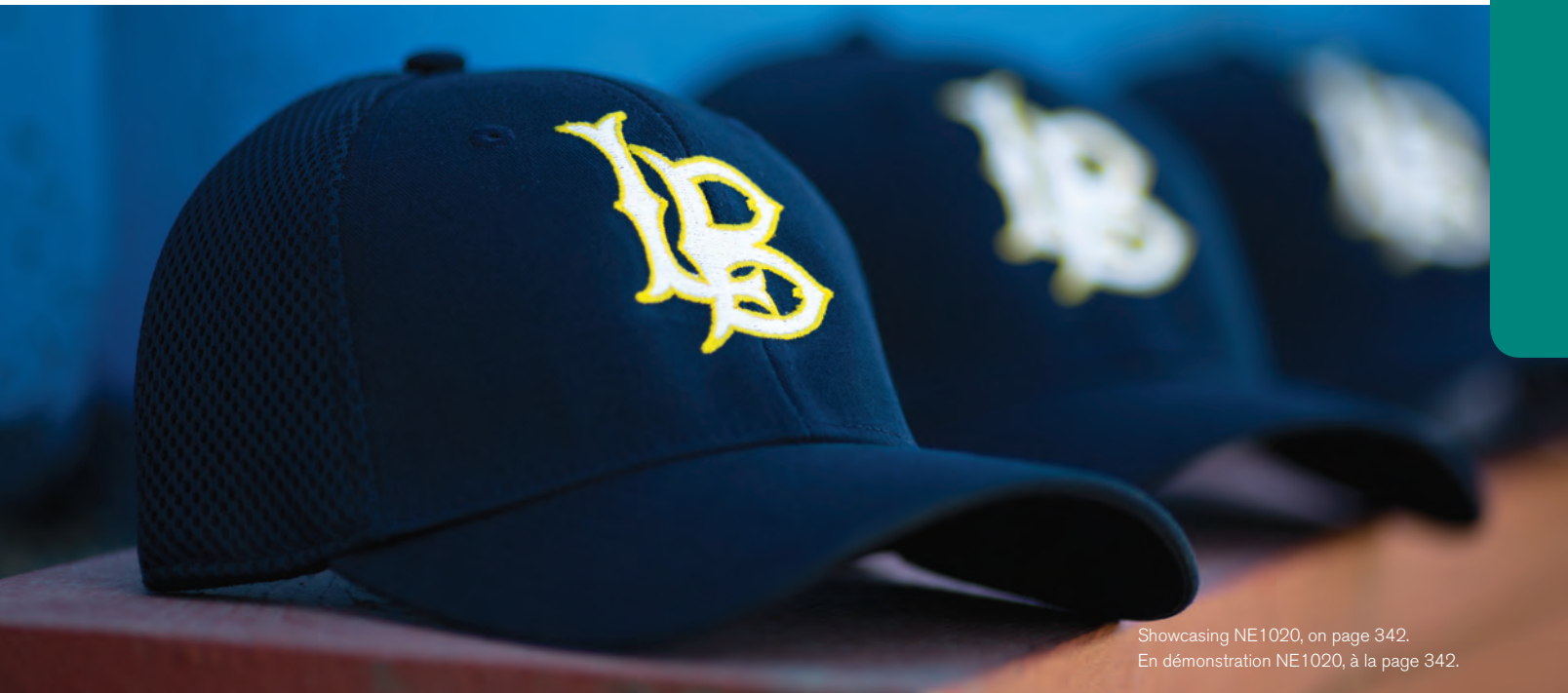
Showcasing NE1020, on page 342. En démonstration NE1020, à la page 342.

TO PROTECT ITS REPUTATION AND IDENTITY, NEW ERA® RESERVES THE RIGHT TO PROHIBIT THE ADDITION TO ANY NEW ERA® PRODUCT ANY TRADEMARK, NAME, DESIGN OR LOGO THAT DOES NOT MEET THE HIGH STANDARDS OF THE BRAND. NEW ERA® PRODUCTS MAY NOT BE SOLD WITHOUT EMBELLISHMENT.