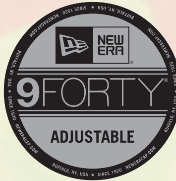
NE406, NE205, NE200

FEATURES A CLASSIC, COLLEGIATE LOOK WITH A CONTOURED CROWN, PRECURVED VISOR WITH EIGHT ROWS OF VISOR STITCHING AND EYELETS ON ALL PANELS.