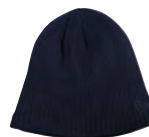
DEEP NAVY MARINE FONCÉ