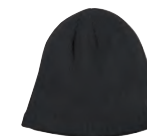
SLATE GREY GRIS ARDOISE