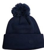
DEEP NAVY MARINE FONCÉ