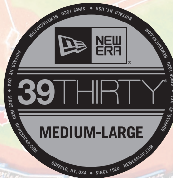
NE1091, NE1121, NE1020, NE1000, YOUTH NE302

FEATURES A CASUAL LOOK WITH A CONTOURED CROWN, PRECURVED VISOR WITH EIGHT ROWS OF VISOR STITCHING AND EYELETS ON ALL PANELS. THE SHAPE AND FABRICS ARE ENGINEERED IN ORDER TO PROVIDE THE ULTIMATE STRETCH FIT CAP.