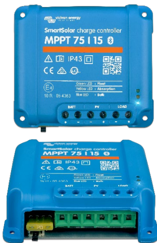
SmartSolar laddningsregulator MPPT 75/15