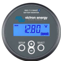
Bluetooth-avkänning BMW-712 Smart Battery Monitor