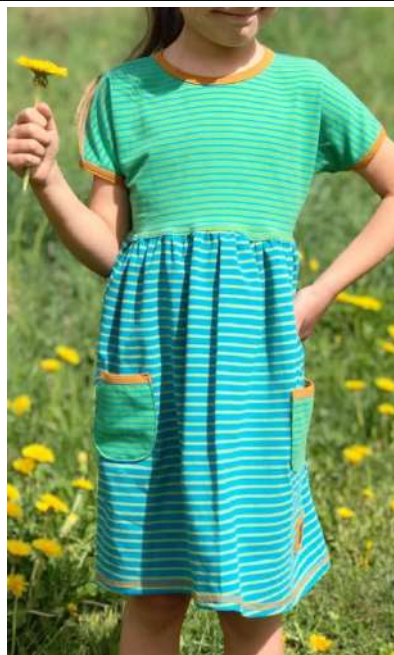
Kleid mit Taschen und Bündchen am Ärmel