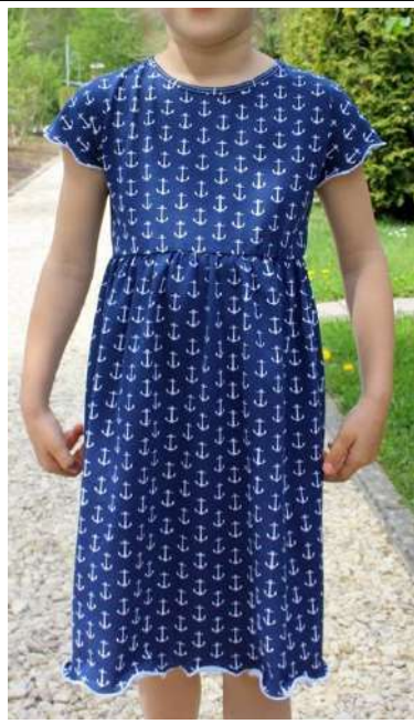
Kleid mit Rollsaum und Rollsaum am eingekürzten Ärmel