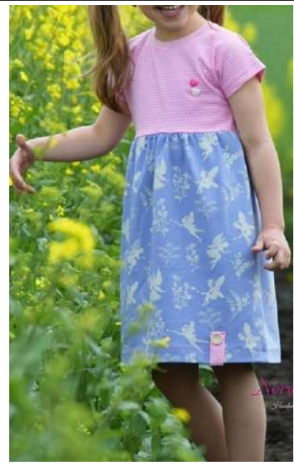
Kleid mit gesäumten Ärmel und Webware Rockteil

ALLE RECHTE DIESER ANLEITUNG LIEGEN BEI LUZIE LINDE ALIAS DIE KOPIE, WEITERGABE VERKAUF ODER TAUSCH SIND VERBOTEN.