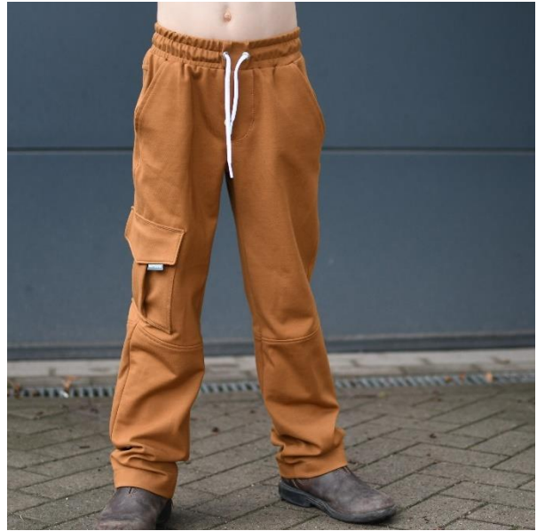
Luca ohne Gummiband im Saum