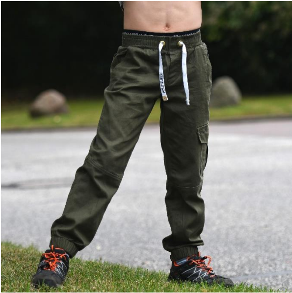
Luca aus Twill mit einer Cargotasche