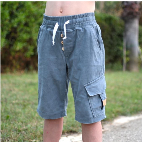
Luca als kurze Hose