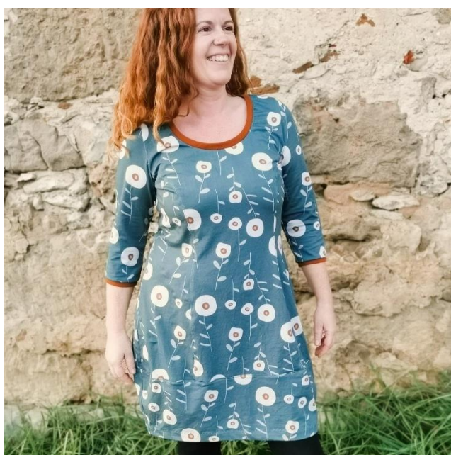
Ballonkleid mit 3/4 Ärmel