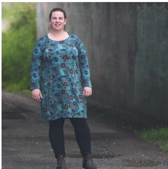
Ballonkleid mit langem Ärmel