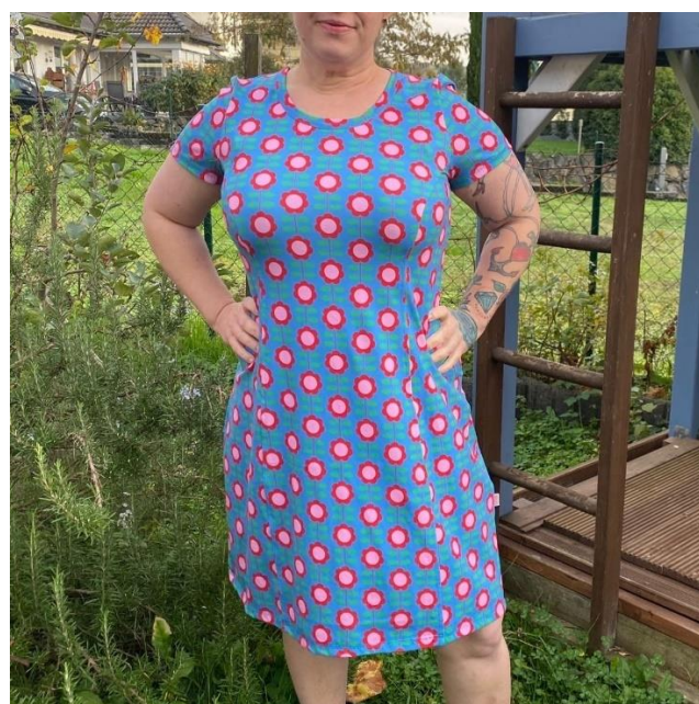
Ausgestelltes Kleid mit kurzem Ärmel