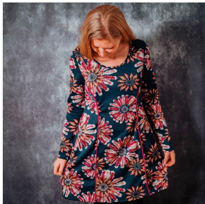
Ausgestellte Variante mit langem Ärmel