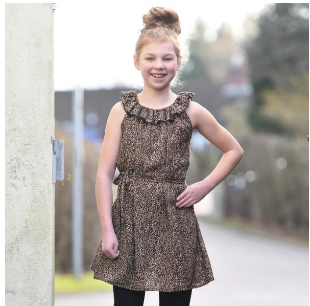
Kleid mit Rüsche