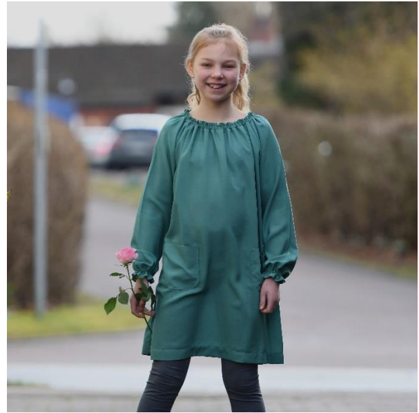
Langärmelig als Kleid mit Taschen