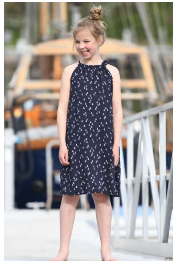
Hängerchen als Kleid