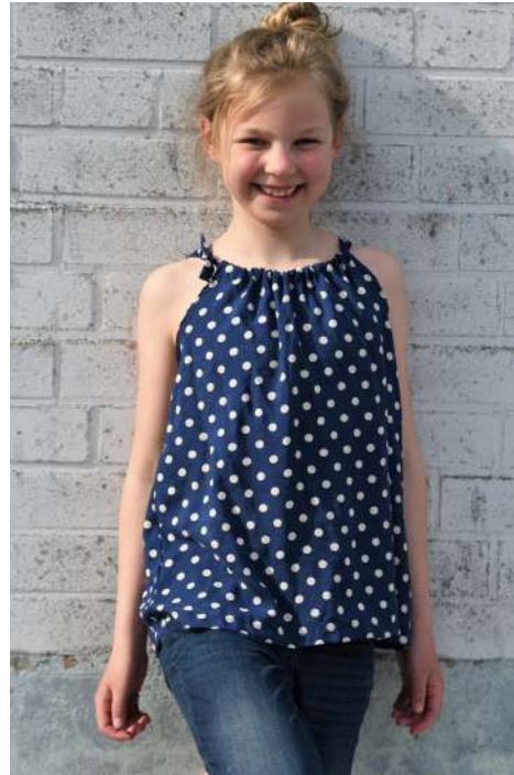
Hängerchen als Top