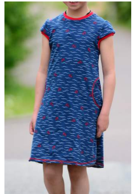
Schnelle Deern mit angesetzten Käppchen und doppelten Taschen in A-Linie.

ALLE RECHTE DIESER ANLEITUNG LIEGEN BEI LUMALI – SCHNITTE MIT K(N)OPF DIE KOPIE, WEITERGABE, VERKAUF ODER TAUSCH SIND VERBOTEN.