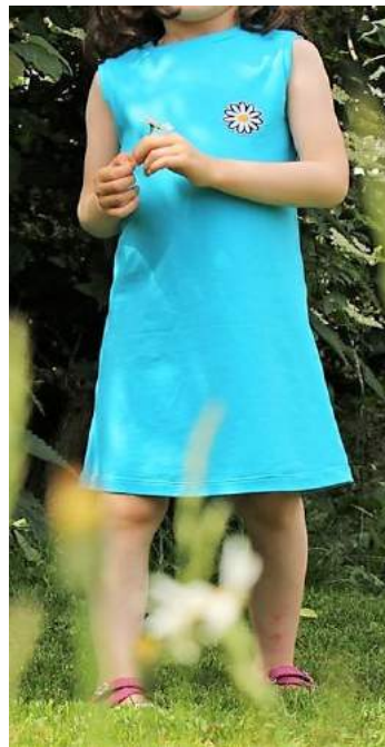
Schnelle Deern ohne Taschen in Trägerversion