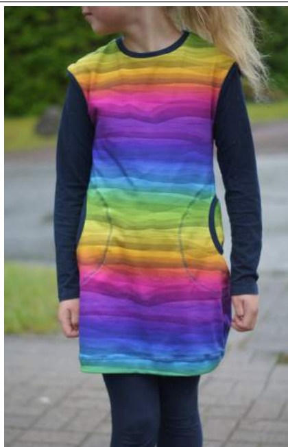
Schnelle Deern Ballonform mit angeschnittenen Käppchen