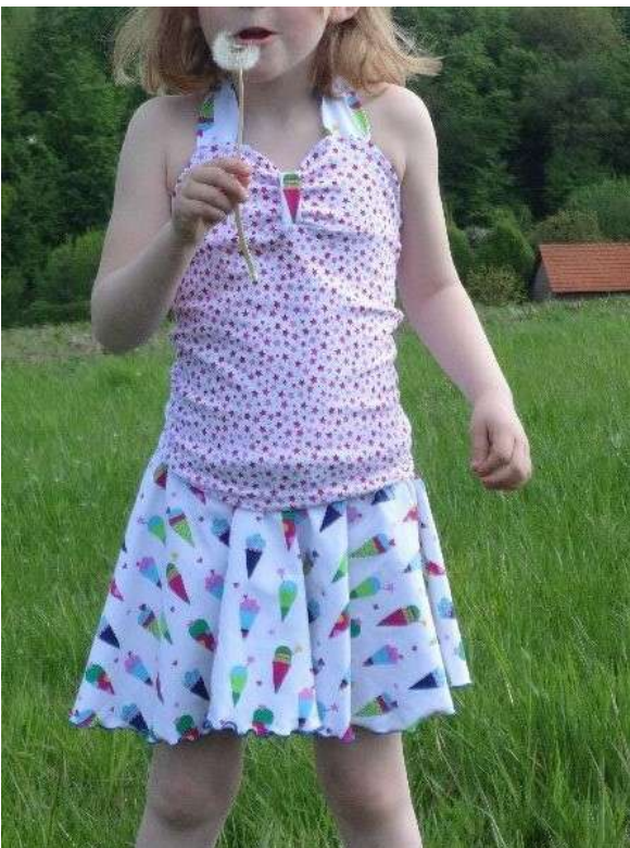
Kleid mit Raffung